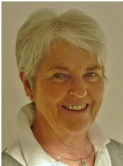
Anita Koller Redaktion Festschrift