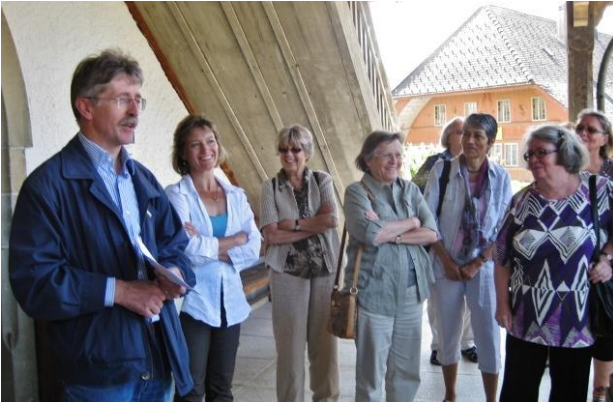
Kirche Sumiswald bei Pfr. Castelberg Mai 2011